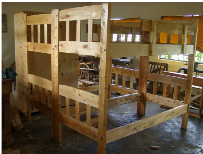
stapel bedden voor Makobe projekt