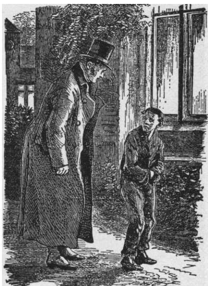
Arme jongen en welgestelde man

Lubbert Brouwer de woning op de Achtergaarde te doen ont-ruimen, wanneer zij hunne oudste kinderen niet ter school en ter catechisatie zenden.’ In de tegenstelling arm-rijk zagen velen geen sociale onrechtvaardigheid, maar een door God gewilde ordening. Welgestelde gemeenteleden lieten de armen nooit geheel aan hun lot over. ‘Weldoen’ stond bij hen hoog in aanzien. Niet alleen bij hen, maar in de hele maatschappij. Filantropie was bepaald in: de ‘fatsoenlijke stand’, die zich soms ver boven de armen verheven voelde, genoot van weldoen. Dat er in de samenleving verschillende standen waren, aanvaardde vrijwel ieder als normaal en als door het Opperwezen (een negentiende eeuwse aanduiding voor God) gewild; als mens moest je je geluk zoeken in de staat waarin God je gesteld had; uiteraard was het geoorloofd je door zedelijke inspanning te verheffen.