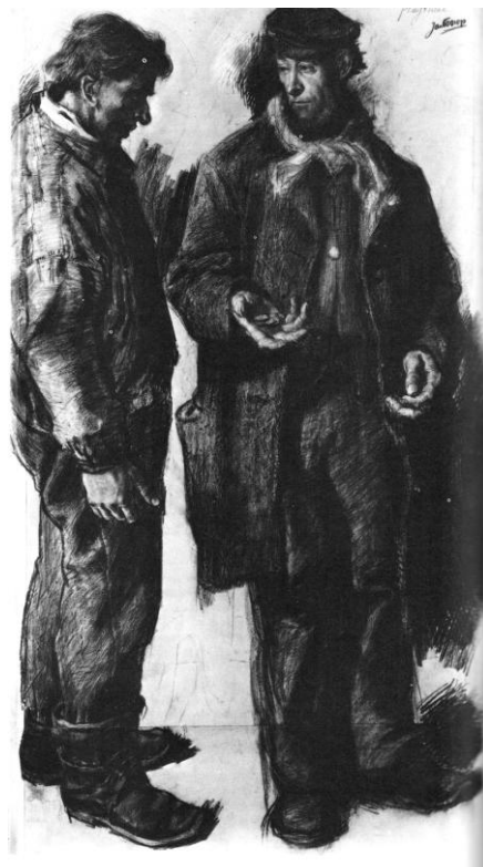
Jan (Johann Theodorus) Toorop (1858-1928), Mauvais salaire (het magere loon), 1886.