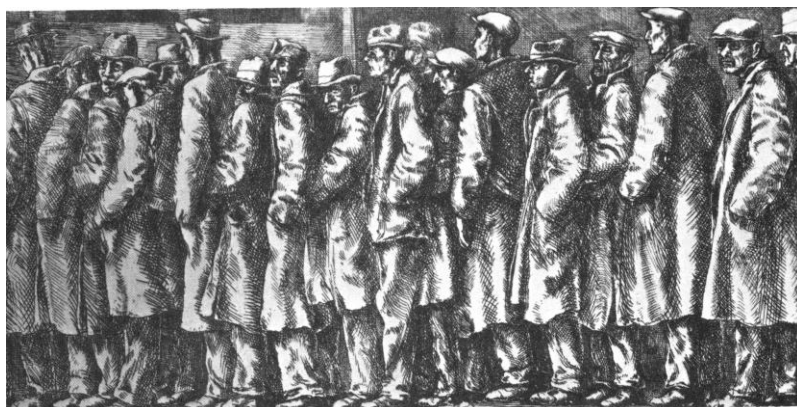
R. March, In de rij voor het brood, ets, 1932.

doen op steun uit de inmiddels door de overheid ingestelde werkloosheidskassen. Deden ze dit, dan wachtten hen allerlei vernederingen. Bij de aanvraag werden niet alleen de eigen verdiensten nagegaan, maar ook die van de kinderen. Uitwonende, nog werkende kinderen moesten voor het onderhoud van hun ouders een wekelijkse bijdrage betalen; van inwonende, nog werkende kinderen werden de verdiensten voor tweederde op de steun