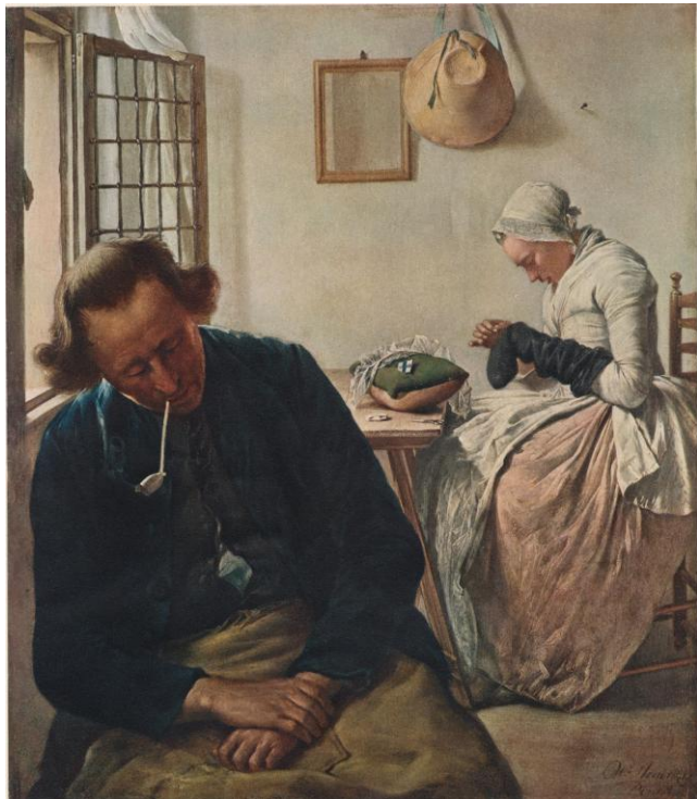
Wybrand Hendriks (1744-1831), Interieur met slapende man en kousenstoppende vrouw , 18.., doek, 38 x 33 cm, Haarlem: Frans Halsmuseum