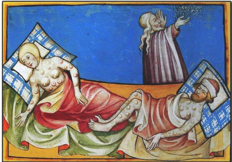
Slachtoffers van een pestepidemie.

Armenzorg was vooral een zaak van de kerken. Tijdens kerkdiensten haalde men geld op om hen die dat dringend nodig hadden bij te kunnen staan. De kleine 'Reformirte Gemeinde' verleende incidentele hulp. Ze deed dat niet alleen door geld te geven aan arme gemeenteleden en berooiden soldaten, maar ook bijvoorbeeld door een linnen doek voor een arm kind te kopen, of schoolboeken voor een jongen die deze niet kon betalen, vier hemden en een hoed voor een man, en een lijkstaf voor een overleden gemeentelid. Toen in 1556 (weer eens) een pestepidemie uitbrak, werd het Jonker Huysens Gasthuis 1 opgericht om onderdak te bieden aan verarmde en zieke burgers. De 'Evangelisch Reformirte Gemeinde' kreeg het beheer over het gasthuis dat al gauw voornamelijk diende tot onderdak voor arme weduwen en ongetrouwde vrouwen.