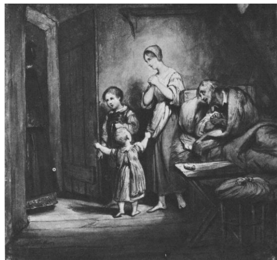
Ary Scheffer (1795-1858), Het arme gezin kijkt in grote dankbaarheid de rijke weldoenster na, die juist het vertrek verlaat.

Begin negentiende eeuw was het volksvoedsel zeer eenzijdig geworden: driemaal daags aardappelen. Een mislukte aardappeloogst, zoals in 1816 / 1817, had dan ook grote gevolgen: velen hadden nauwelijks meer te eten. Vooral 1816 was een rampjaar. Door aanhoudende stortregens in Duitsland en Zwitserland steeg het water in de Rijn en IJssel zo hoog, dat de zomerkaden het niet meer konden keren. De Loowaard liep op 8 juli onder water. Ook een groot