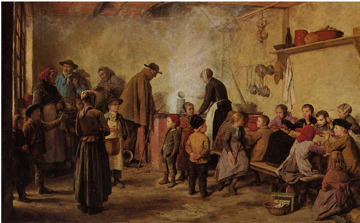
Albert Anker (1831-1910, Die Armensuppe , 1860.