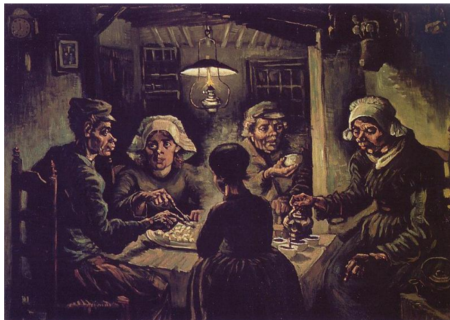
Vincent van Gogh (1853-1890), De aardappeleters (maart-april 1885), olieverf op doek, 82 × 114 cm, Amsterdam: Van Gogh Museum.

Om haar taak naar behoren te kunnen uitvoeren, had de diaconie sterk de behoefte aan 'levend geld': geld dat uit min of meer spontane giften werd verkregen. De kerkenraad probeerde de bron van dit geld stromend te houden. Op 28 november 1917 besloot hij 'met het oog op de duurte der kledingstoffen voor de winterklerenuitdeling aan behoeftigen een extra collecte in de kerk te houden en die tijdig aan de gemeente met nadruk aan te bevelen.' De diaconie ondersteunde weeskinderen tot deze zeventien waren, de leeftijd waarop ze geacht werden zelf hun brood te kunnen verdienen. Ze bezat enkele kleine huizen, die armen voor een gering bedrag konden huren. De diaconie was ervan overtuigd dat op de gemeenschap de taak rustte de zwakkeren en onterfden in haar midden te beschermen, opdat ook zij tot ontplooiing konden komen. Arme zorg werd door de overheid nog altijd gezien als een aangelegenheid waarmee de staat alleen in laatste instantie te