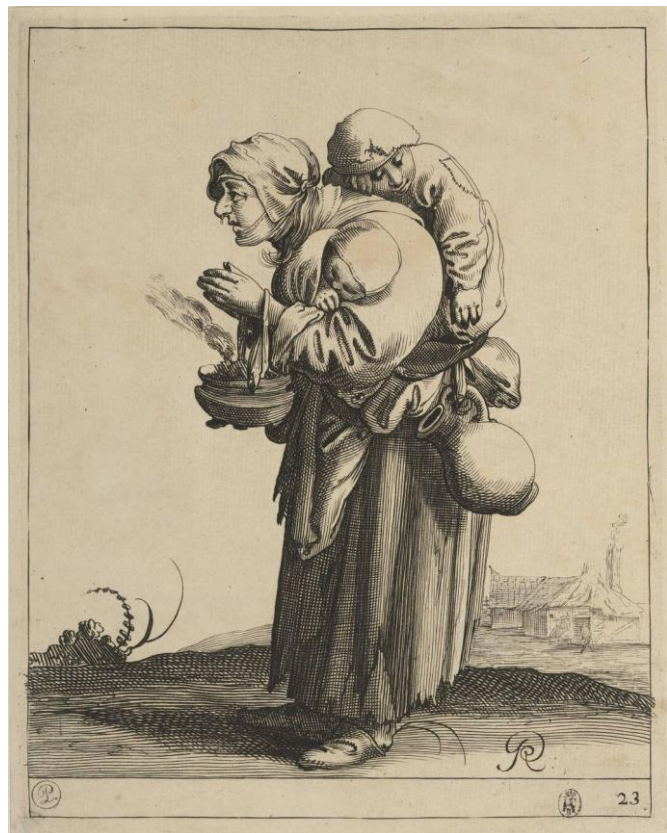
Pieter Jansz. Quast, Bedelares met kind , ets, 19,6 x 16,2 mm, 1638; Boijmans Thesaurus

In de achttiende eeuw werd het werk van de diaconie op dezelfde voet als in de voorgaande eeuwen voortgezet; de armen werd nu eens hout gegeven, dan weer graan en aardappelen (om te eten of te poten), kleding of geld. De kosten voor een doods-kist of een begrafenis en de rekening van een arts werden meermalen betaald door de diaconie en gemeenteleden werden te hulp geschoten nadat ze door een dijkdoorbraak of een andere ramp waren getroffen. Een enkele keer was de hulp langdurig. Zo bijvoorbeeld aan het dochttertje van Anna Catharina Nobelsberg: Anna Ca-