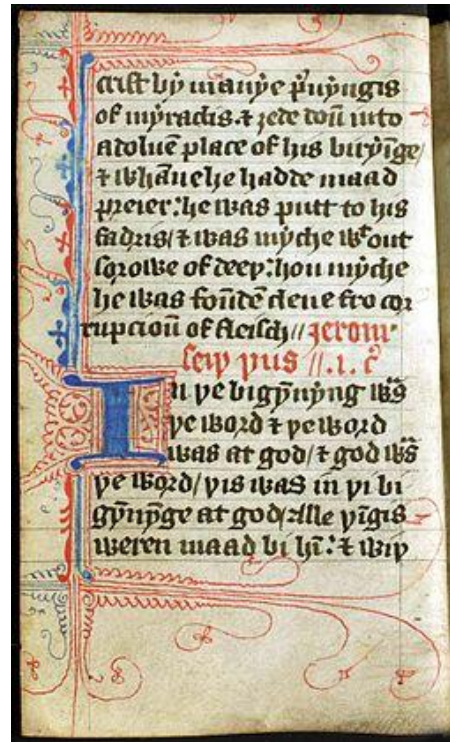
Wicliffes vertaling van het begin van het Johannesevangelie.

Vries, Theun de, Ketters. Veertien eeuwen ketterij, volksbeweging en kettergericht , Amsterdam: Em. Querido's Uitgeverij B.V. 1982.